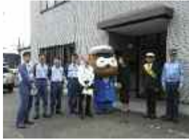
9/29 事業所訪問 横河ソリューションサービス 京滋営業所様