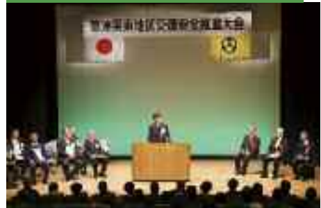
11/17 草津栗東地区交通安全推進 大会（草津アマカホール）