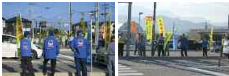
9/27 「秋の全国交通安全運動」 セーフティアップ活動