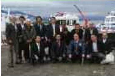
10/25 役員研修会 大津署警備艇乗船