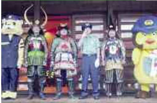
9/20 秋の全国交通安全運動出動式 歌手 Lefa北川さんの1日署長