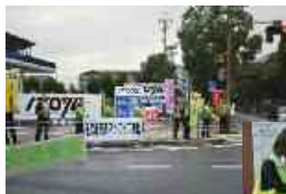
10/25 近江路交通マナー アップ運動啓発