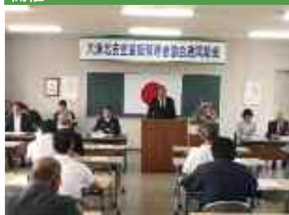
5/27 安全運転管理者協会通常総会の 開催