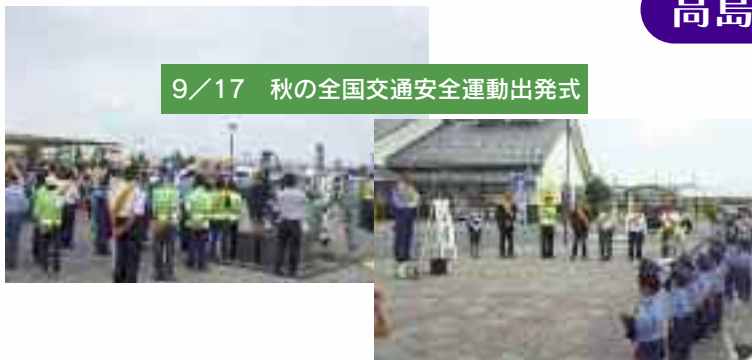
9/17 秋の全国交通安全運動出発式