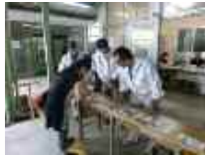
9/24 安全フェア 子供免許証