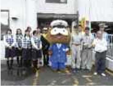
9/29 事業所訪問 関西ティーイーケー様