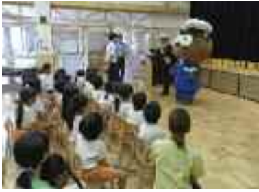
9/29 事業所訪問 星の子保育園様