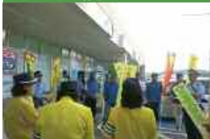
9/26 「秋の全国交通安全運動」 マナーアップ活動