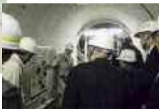
11/14 平成28年度会員研修会 (岐阜県横山ダム)