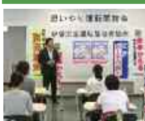
9/25 思いやり運転競技会の開催 (北近江自動車学校)