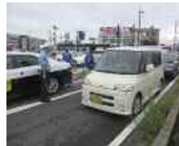
シートベルト着用街頭啓発活動 イズミヤ堅田店前