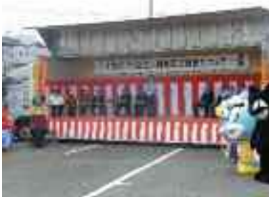
9/24 安全フェアの開催