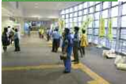
9/30 「秋の全国交通安全運動」 事故死ゼロを目指す日