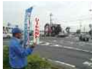
9/26 県下一斉シートベルト啓発