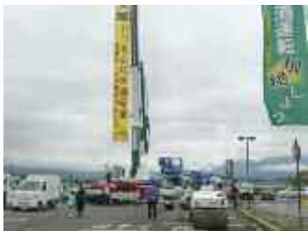
車両展示及び垂れ幕の状況