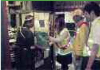
9/23 飲食店に対する飲酒 運転撲滅の啓発