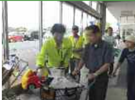
9/26 ハンドルキーパー推進運動の啓発活動