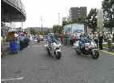
9/21 秋の全国交通安全運動 大津警察署での出動式