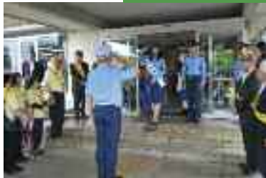
9/19 一日警察署長出動式・啓発