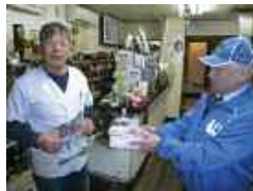
12/9 飲食店に対する飲酒運転撲滅の啓発