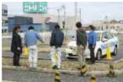
11/10 中型ドライバー安全運転再 確認スクール（アヤハ自動車教習所）