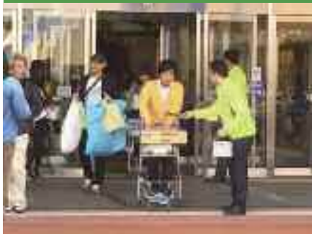
11/1 自転車安全利用の啓発活動