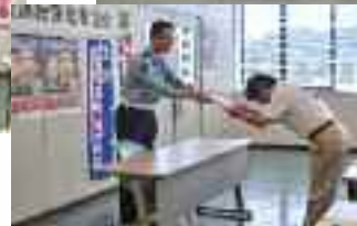
11/19 交通安全長浜市民伊香大会の開催 (木之本スティックホール)