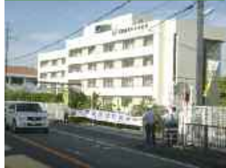
9/30 交通事故死ゼロを目指す日の 啓発 石原産業株式会社前県道