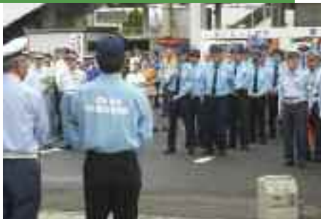
9/21 JR栗東駅前での秋の全国交通安全 運動街頭啓発