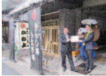
4/11 事業所訪問 株式会社 かねよ様