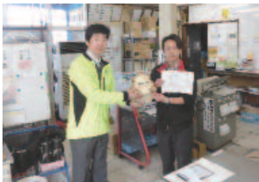
4/13 「無事カエル」 事業所訪問活動