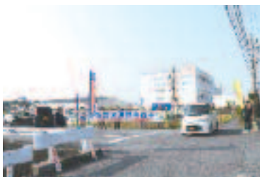
4/14 事業所前のキャノンマ シナリー様での啓発活動