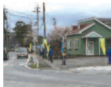
4/12 セーフティアップ米原 啓発活動