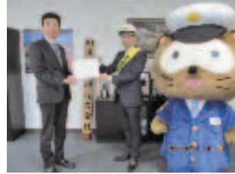
4/11 事業所訪問 滋賀特機株式会社 様