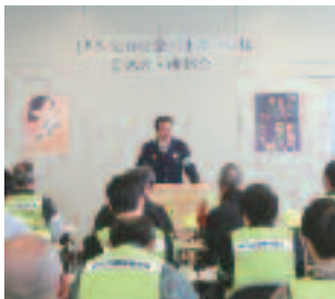
4/4 伊香交通安全パトロール隊委嘱式・研修会 (北近江自動車学校)