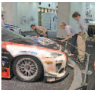
5/19・20 県外研修 (トヨタ会館)