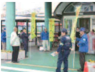
4/6 マナーアップ米原啓発活動