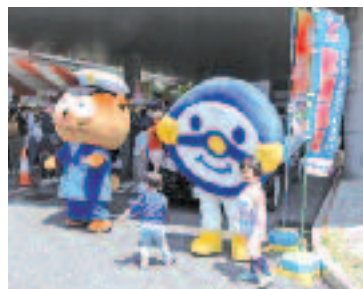
4/30 草津宿場祭りでのハン ドルキーパー啓発