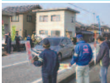
4/14 セーフティアップ米原 啓発活動