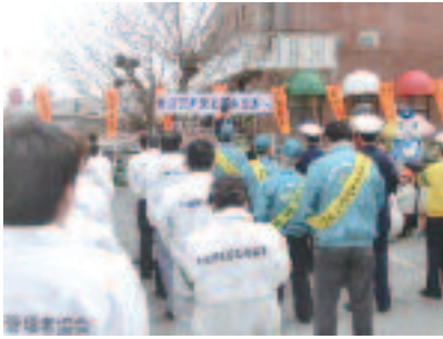
4/6 春の全国交通安全運動出動式 (近江八幡市役所前)