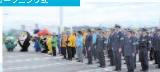
4/6 春の全国交通安全運動 オープニング式