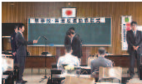
3/7 無事故無違反運動優良事業所表彰