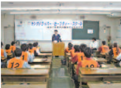
4/12 ヤングドライバー・セーフティ ー・スクール