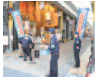
4/12 飲酒運転撲滅啓発 (草津駅前商店街)