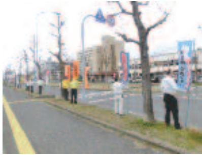
4/6 出動式後の街頭啓発活動