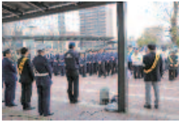
4/6 春の全国交通安全運動街頭啓発活動 (JR南草津駅前)