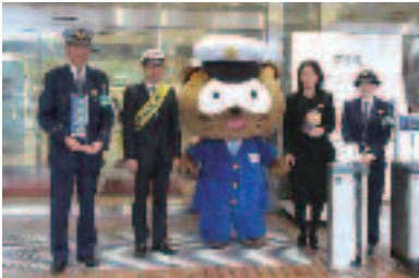
4/11 事業所訪問 株式会社 そごう・西武 西武大津店様