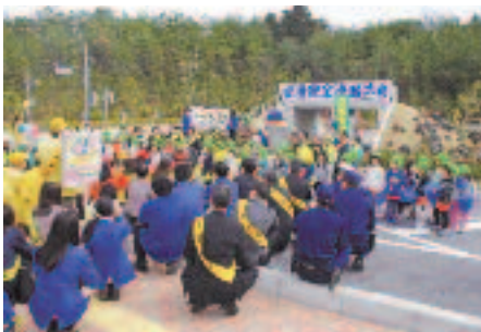
4/6 春の全国交通安全運動決起大会 (クレフィール湖東子ども交通公園)