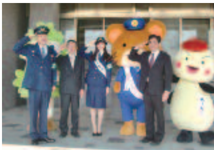
5/16 平成28年度 優秀事業所表彰式