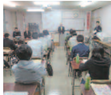
4/11 若年ドライバースクール (野洲自動車教習所)