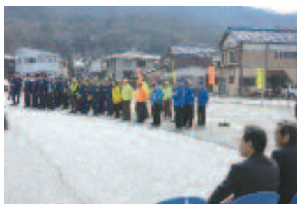
4/5 春の全国交通安全運動出動式