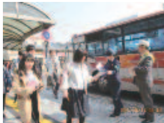
4/14 瀬田駅前「ながらス マホ防止」啓発