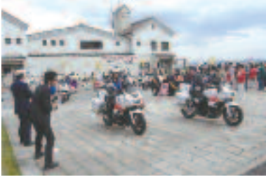
4/6 春の全国交通安全運動 オープニング式