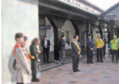
4/6 春の全国交通安全運動出動式 (JR長浜駅)