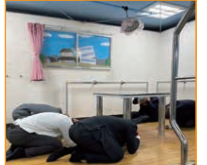
会員視察研修 地震体験