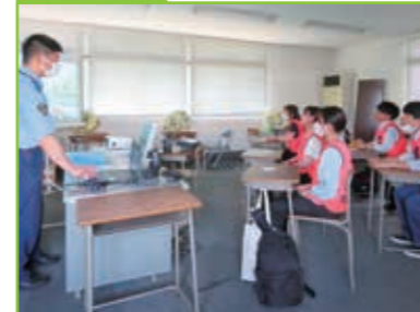
若年運転者交通安全教室 石部自動車教習所