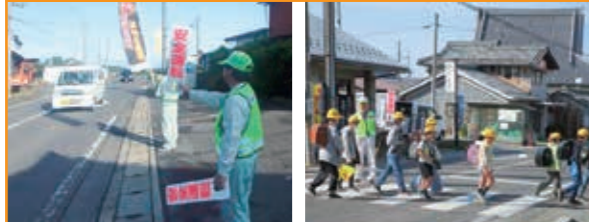
秋の全国交通安全運動 期間中 各会員事業前にて立番啓発