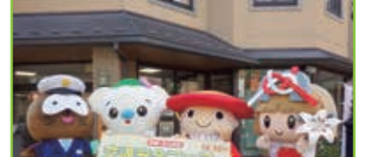
交通安全フェア啓発活動 (1市3町ゆるキャラと共に)