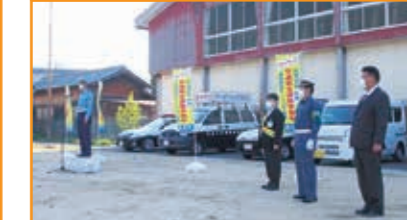
セーフティ作戦の活動 大津市役所小松支所