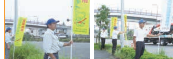
シートベルト・チャイルドシート着用啓発活動 ビエリ守山