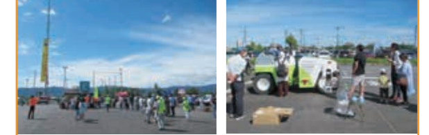
交通安全フェスタ ビエリ守山