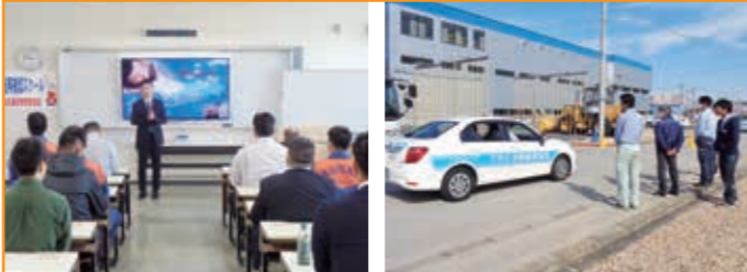
中堅ドライバー安全運転再確認スクール アヤハ自動車教習所において、協会事業所の中堅ドライバーを対象にした教習指導員による安全運転講習を実施