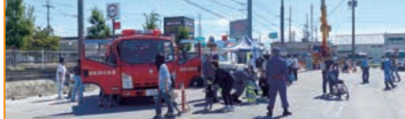
はたらく車 西友長浜楽市店