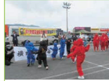
秋の全国交通安全運動 オープニング式 イオンタウン湖南