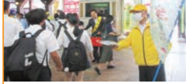
駅頭啓発 長浜駅前