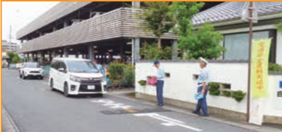
「秋の全国交通安全運動」街頭活動 JR栗東駅前付近において、通行車両や歩行者に対して交通安全啓発を実施