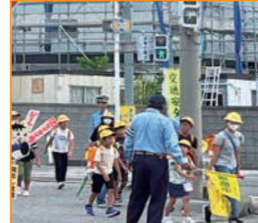
登校時間帯の通学路見守り活動