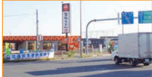
「秋の全国交通安全運動」の協会独自の交通安全街頭啓発 草津市の国道1号草津三丁目交差点において横断幕等を掲げ、通行車両等に対して安全運転を呼びかけた