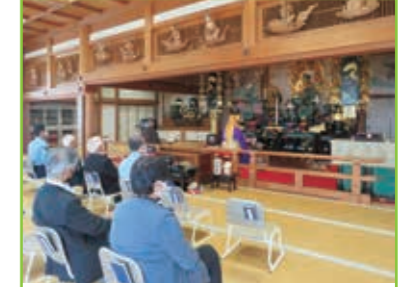
交通事故物故者慰霊祭 大徳寺