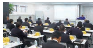
イシダでの研修の様相