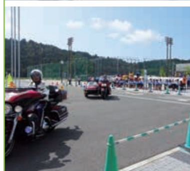
秋の全国交通安全運動出動式 長浜伊香ツインアリーナ