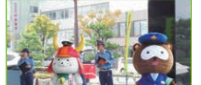
秋の交通安全運動出動式 (ひこにゃん一日署長)