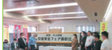
交通安全フェア表彰式 四番町スクエア