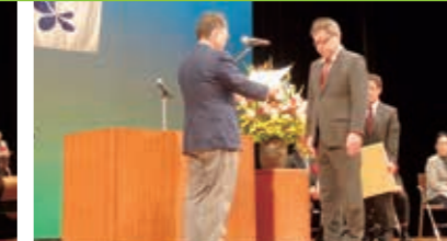
高島交通安全市民大会 藤樹の里文化芸術会館