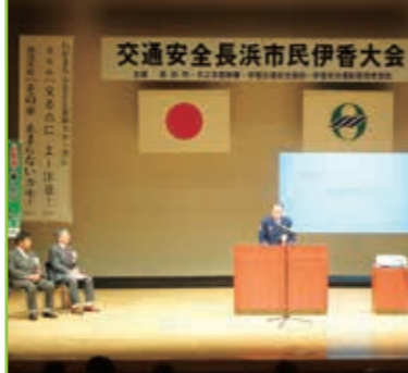
交通安全長浜市民伊香大会 木之本スティックホール