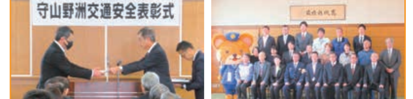
守山野洲交通安全表彰式