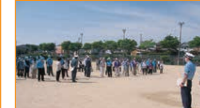
交通安全ゲートボール大会 和邇市民運動公園