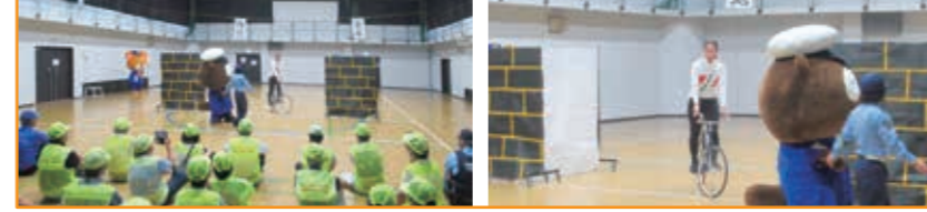
秋の全国交通安全運動 オープニングパフォーマンス式 もりやまエコパーク