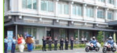
秋の交通安全運動出動式 彦根市役所