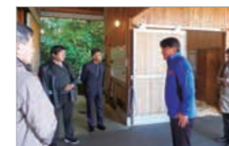
栗東市長の表敬訪問

最初の研修先である「TCCセラピーパーク」では、引退した競走馬が子どもたちのセラピーに役立っており、馬の世話もセラピーの一環としての説明を受けました。 参加した役員の方々もそれぞれ馬へのエサやり体験をさせていただきました。馬を間近に見て、その迫力に圧倒されつつ、手にしたニンジンが何とか馬に食べさせることができ、馬の管理も安全運転管理も、どちらも難しいとの声も聞かれました。 また、研修途中には、栗東市長の表敬訪問というサブライズもあり、同施設に対する行政上の期待の大きさが窺えます。