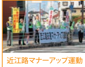
近江路マナーアップ運動