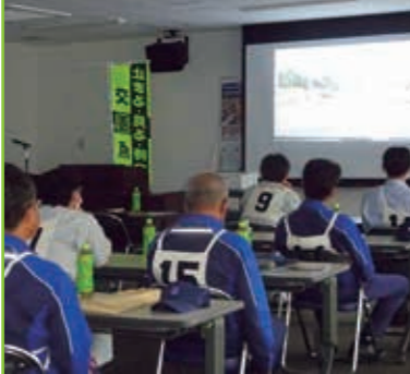
思いやり運転講習サポートカー体験会 高月まちづくりセンター