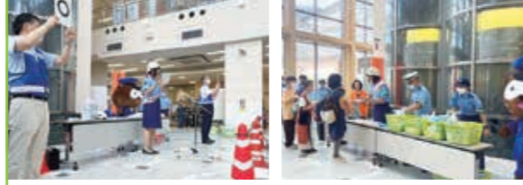
出動式後の啓発活動 イオン近江八幡店