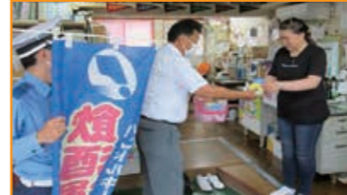
飲酒運転撲滅運動に伴う事業所2ヶ所への訪問啓発 丸西建設及びスギト