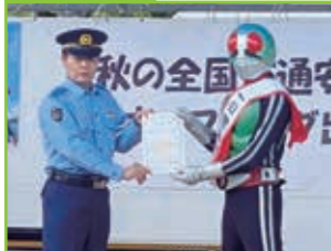
秋の安全運動出動式 三井寺