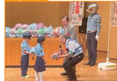
市内子ども園へ自転車用ヘルメット贈呈