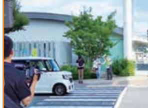
死亡事故多発警報発令に ともなう啓発