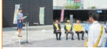
一日警察署長 出動式