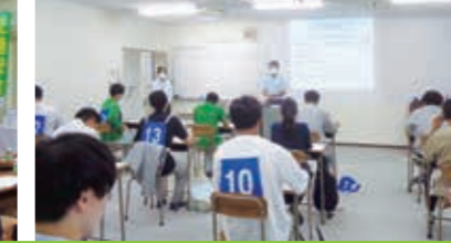
若年者安全運転競技会 湖西自動車教習所