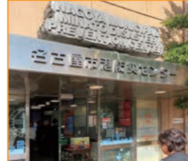
会員視察研修名古屋防災センター視察