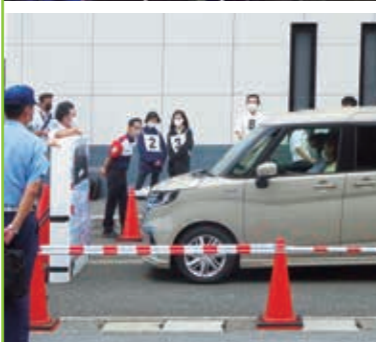
思いやり運転講習サポートカー体験会 高月まちづくりセンター