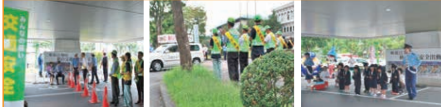
秋の全国交通安全運動 出動式