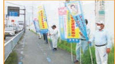
秋の全国交通安全運動のぼり旗啓発活動 琵琶湖大橋交差点