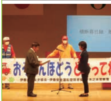
交通安全長浜市民伊香大会 木之本スティックホール