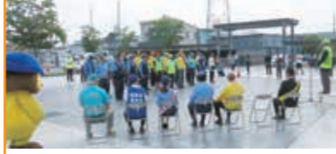
出動式 長浜市役所