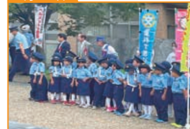
秋の全国交通安全運動 出動式