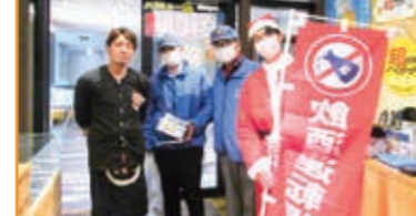
飲酒運転根絶啓発活動