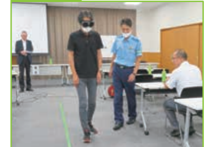
新規安全運転管理者選任事業所 事業主講習会 甲賀警察署