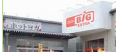
彦根ビッグにて啓発活動