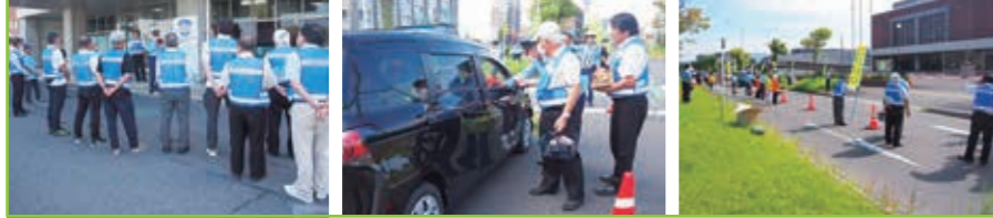
交通死亡事故ゼロ啓発