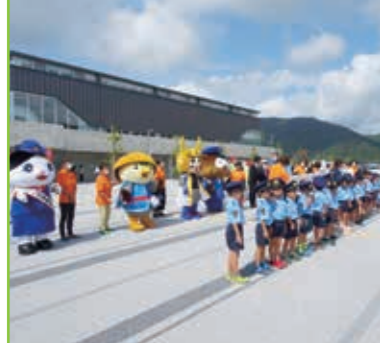
秋の全国交通安全運動出動式 長浜伊香ツインアリーナ