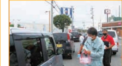
飲酒運転撲滅啓発活動 大津市今堅田地先