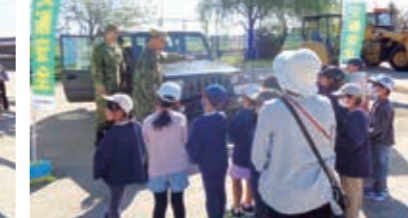
はたらく車交通安全教室 新旭北小学校