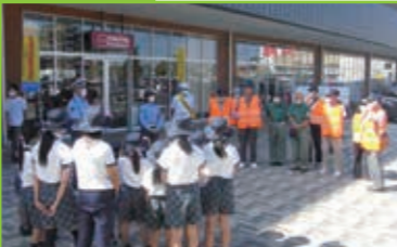
啓発 ブランチ大津京