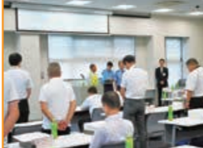
地区表彰式 優良運転者・優良管理者 無事故・無違反運動達成事業所