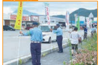
マナーアップ米原啓発活動