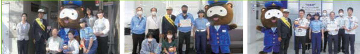
事業所訪問 3事業所