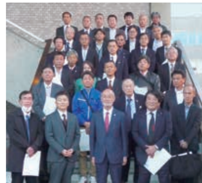
イシダでの記念撮影

から高齢者の認知機能と交通事故との因果関係などに関する講話を聴講しました。 講習の中で、交通課長から増加傾向にある交通事故の発生に関し、「特に自転車事故・二輪車事故の発生を危惧しており、その予防策は、昔から言われ続けていた「右見て、左見て、右見る」ことの重要性をドライバークラス、自転車乗車者、歩行者がそれぞれ認識して、確実に実践することが肝要であると改めて痛感している。」と強調されたことに対して、多くの聴講者が納得・首肯する姿がみられました。 講習終了後、意見交換会を行い、各地区協会の役員間で情報交換が行われました。