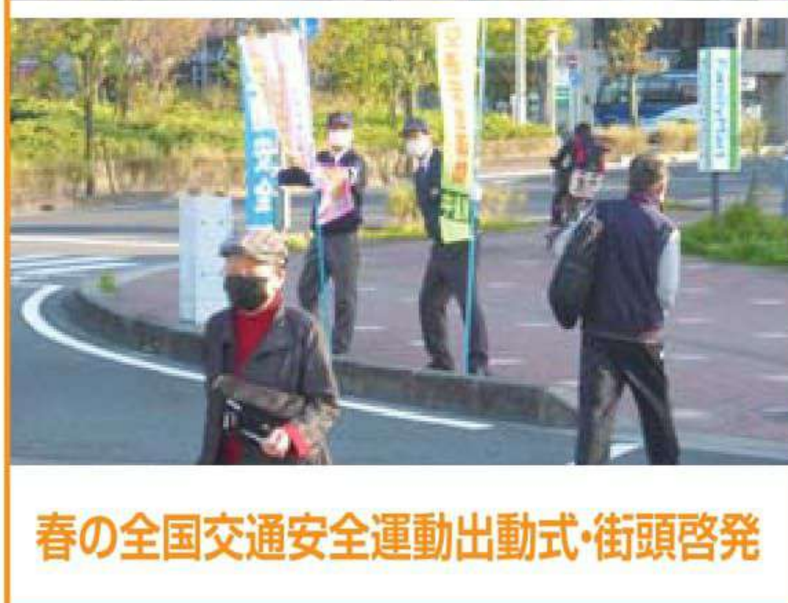
春の全国交通安全運動出動式・街頭啓発