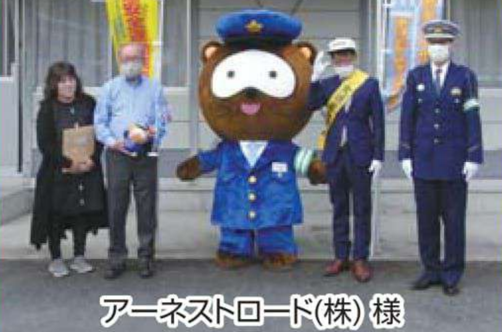
アーネストロード(株)様