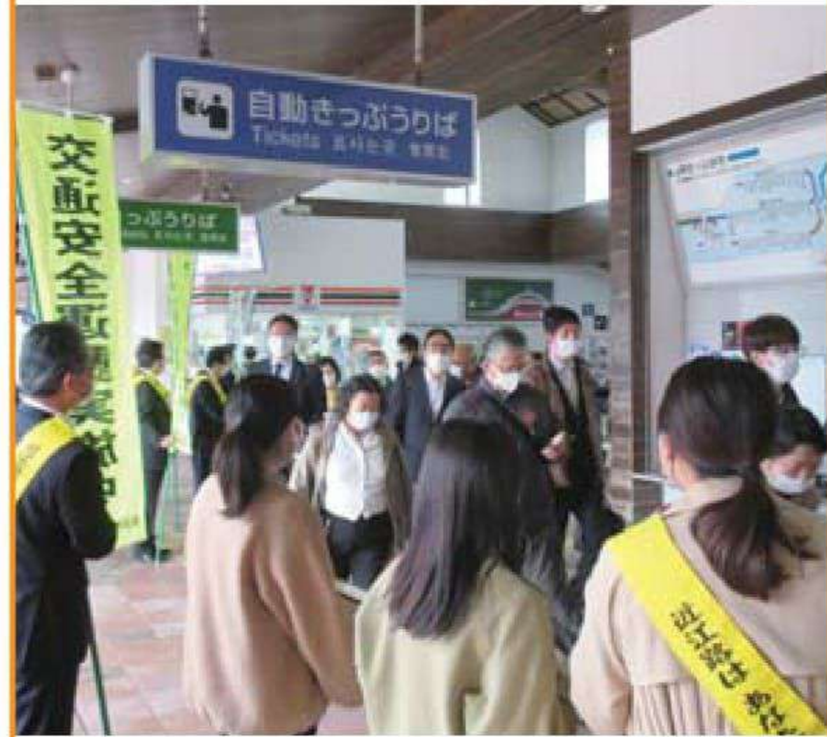
春の全国交通安全運動 JR長浜駅