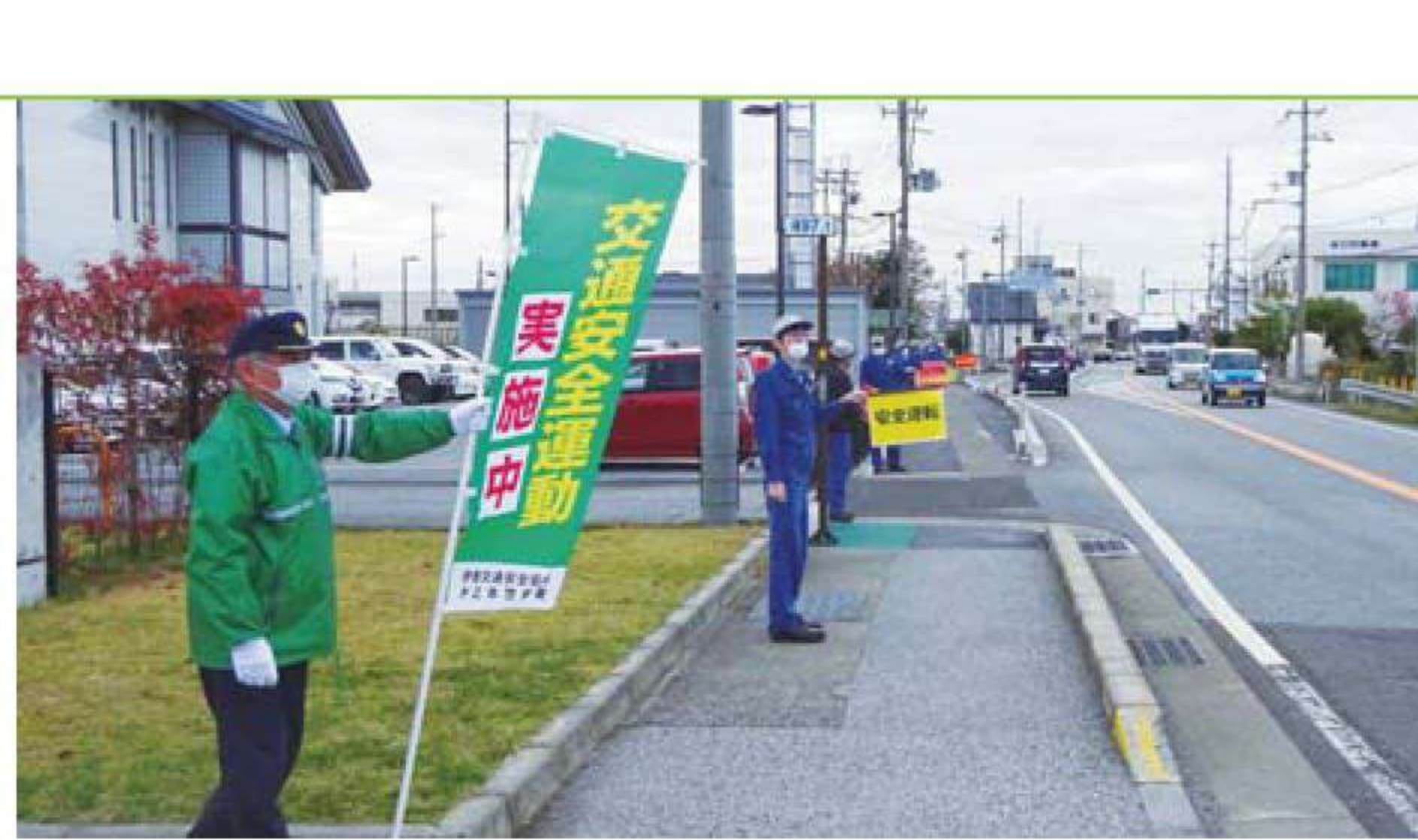
国道8号線にて従業員手作りパネルで啓発