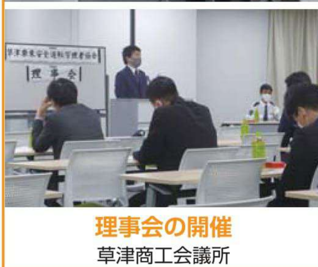
理事会の開催 草津商工会議所