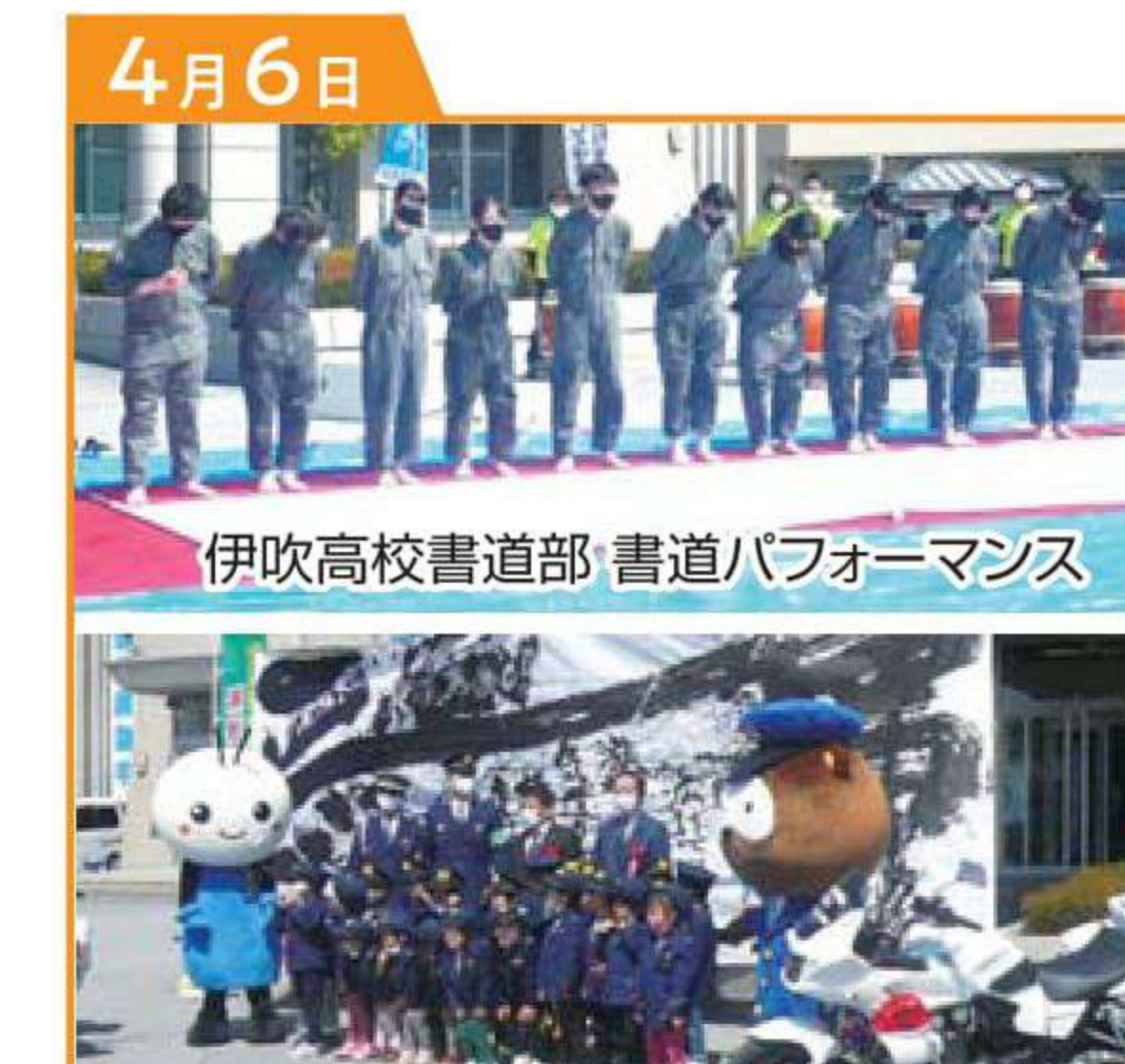
伊吹高校書道部 書道パフォーマンス パフォーマンス作品とシブリアポロ 春の全国交通安全運動 出動式 米原警察署