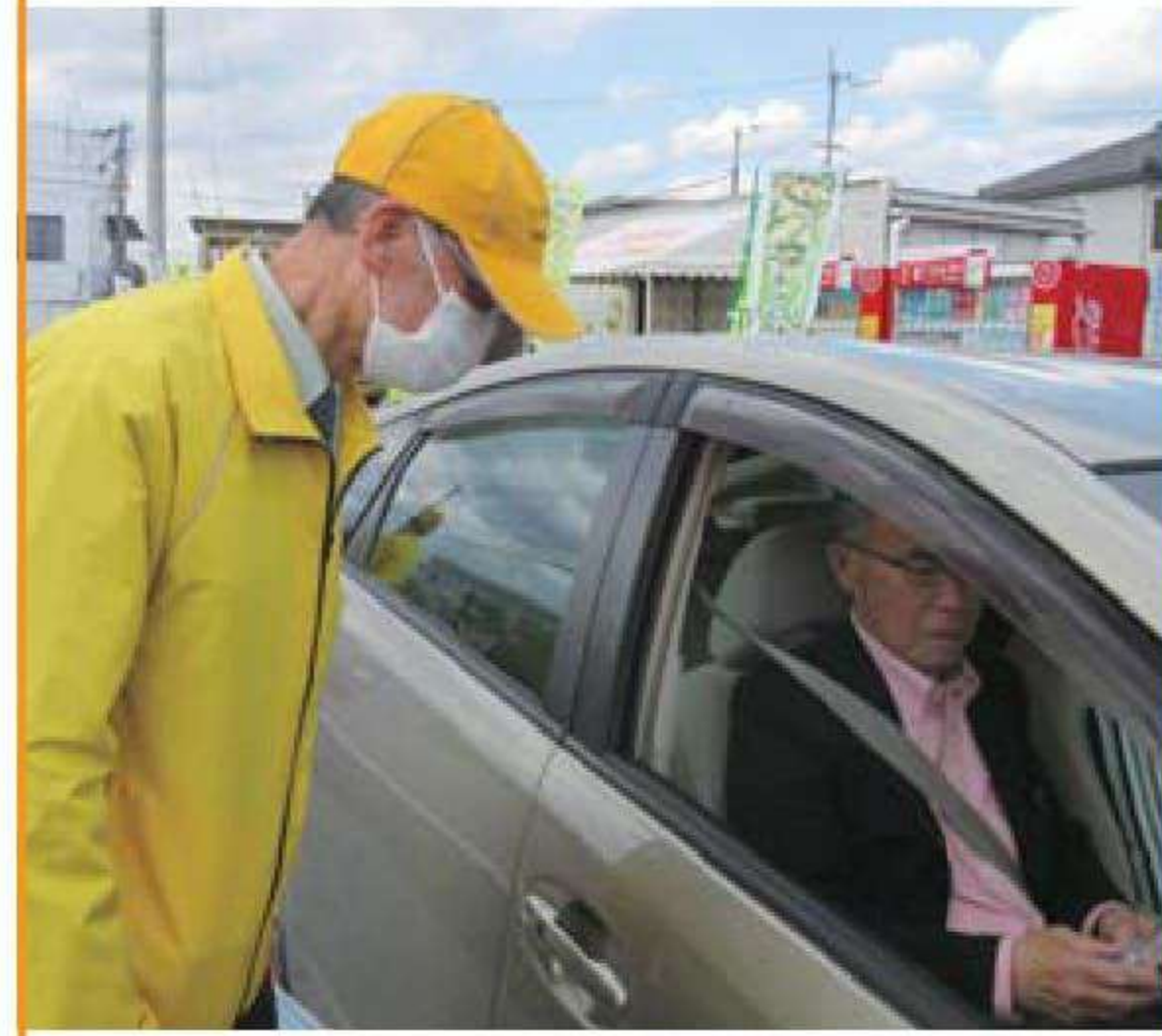
春の全国交通安全運動 交通死亡事故ゼロを目指す日 富久や前