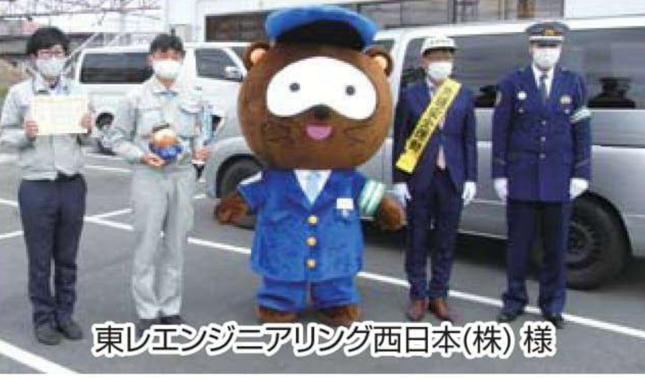
東レエンジニアリング西日本(株)様