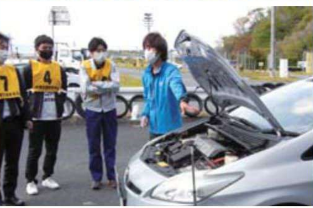
安全運転点検技能研修