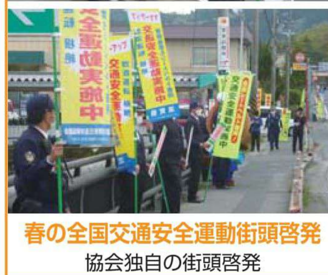
春の全国交通安全運動街頭啓発 協会独自の街頭啓発