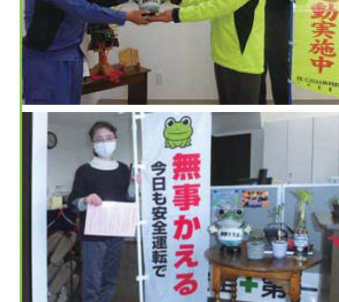
「無事かえる」事業所訪問