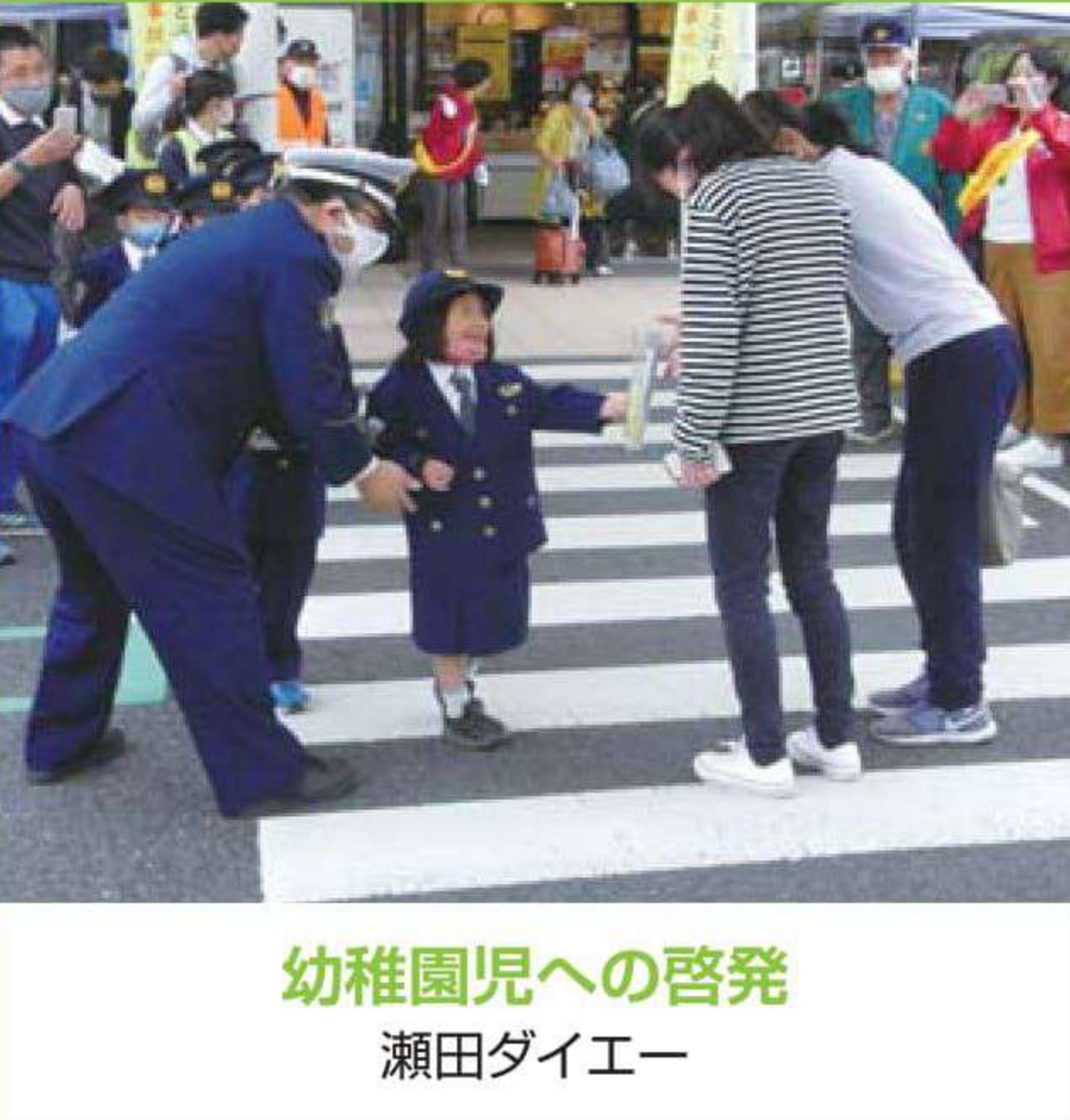
幼稚園児への啓発