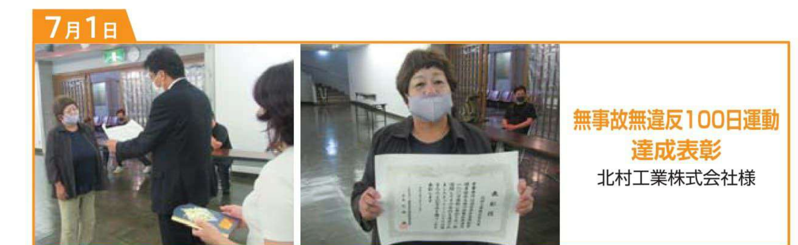
無事故無違反100日運動達成表彰 北村工業株式会社様