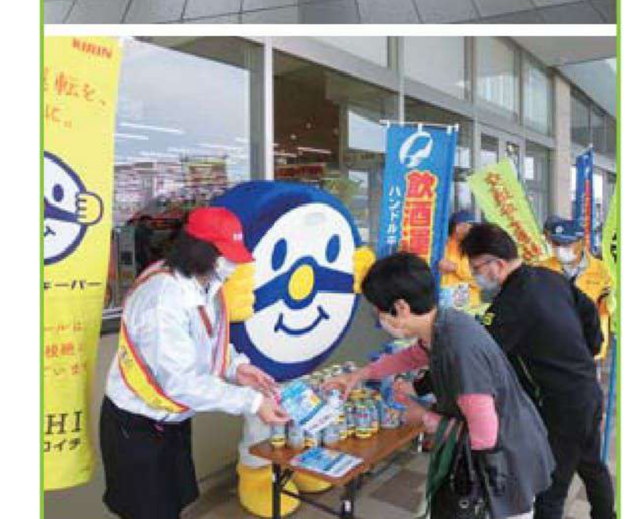
飲酒運転撲滅運動