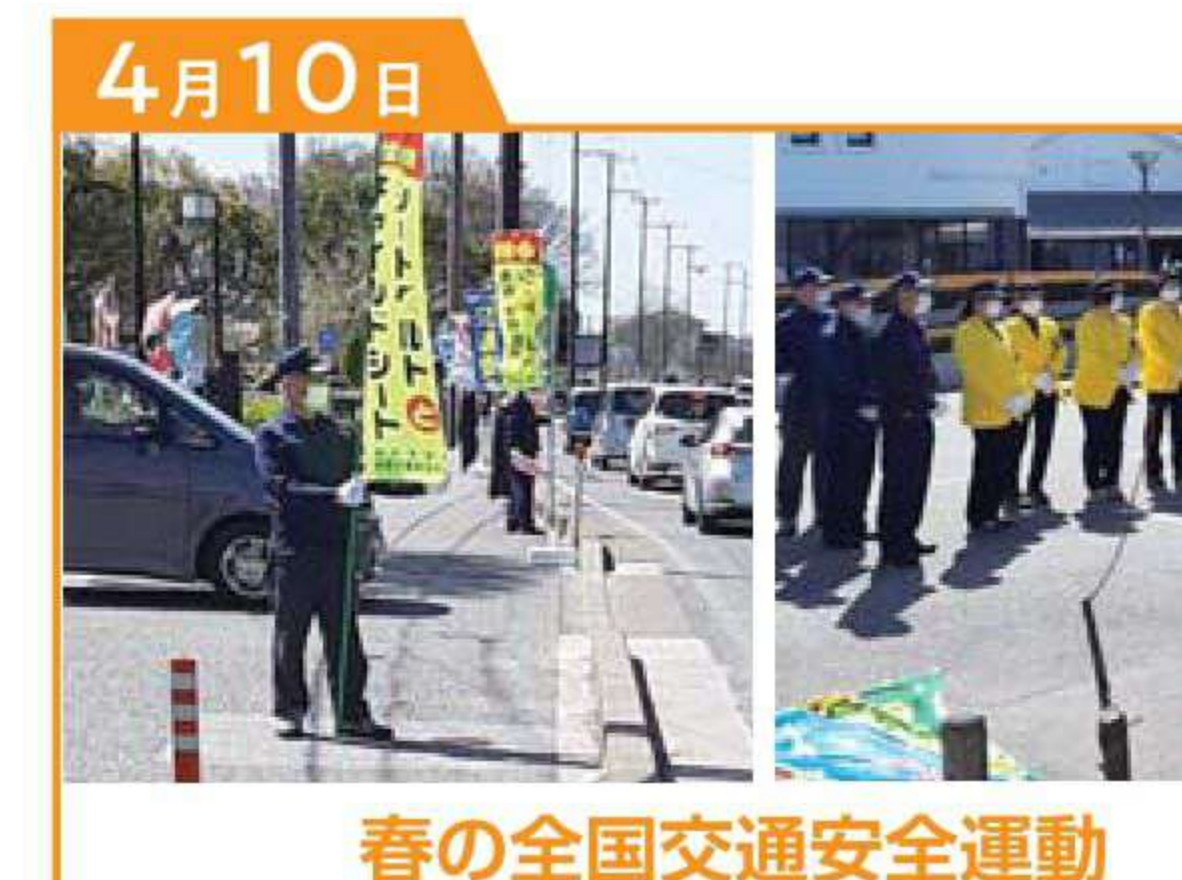
春の全国交通安全運動 交通事故死ゼロを目指す日 道の駅 近江母の郷