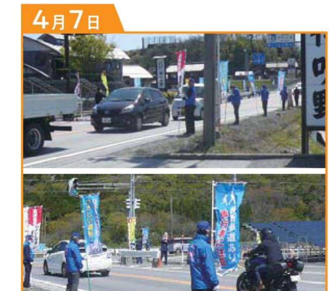
春の全国交通安全運動 マナーアップ「米原」 道の駅 伊吹の里