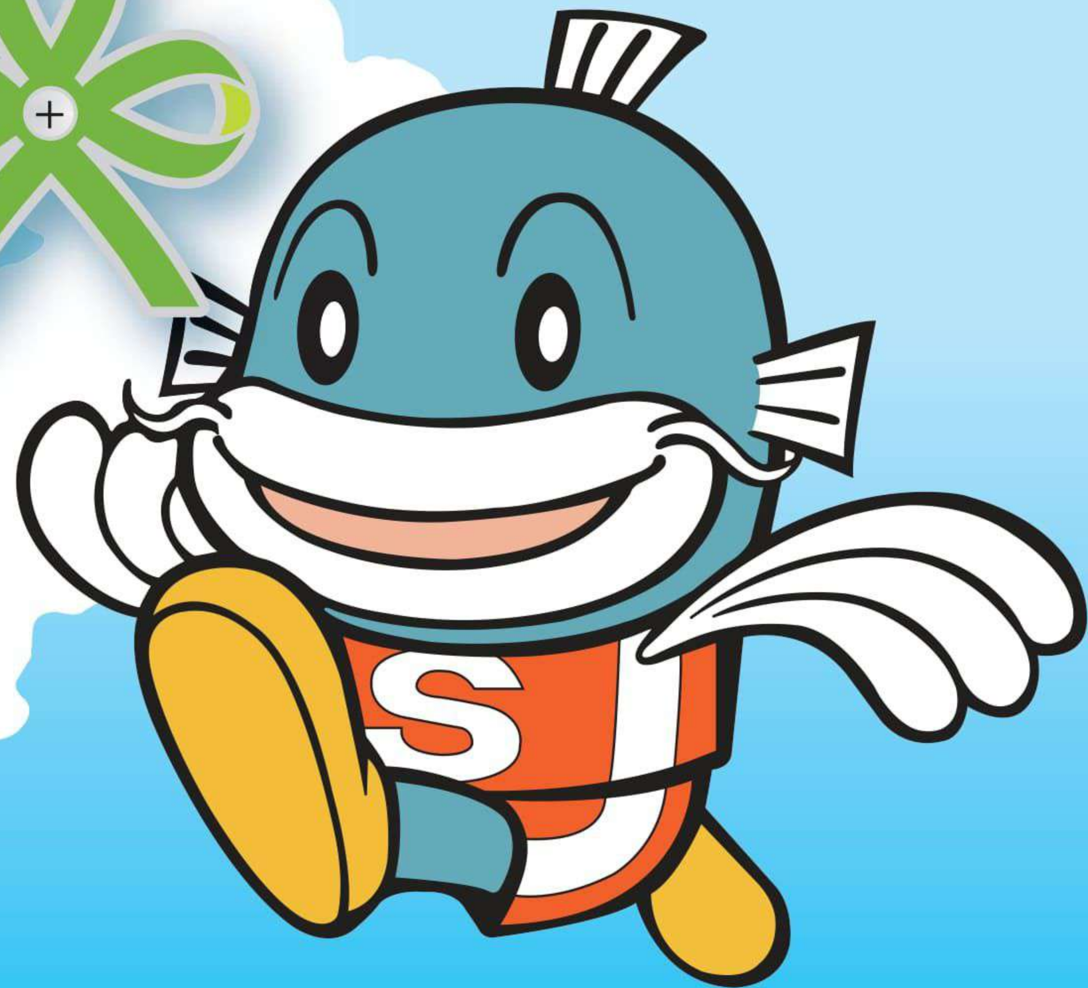
滋賀県イメージキャラクター 「キャッピー」