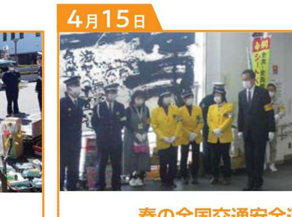
春の全国交通安全運動 セーフティーアップ「米原」 JR米原駅自由通路