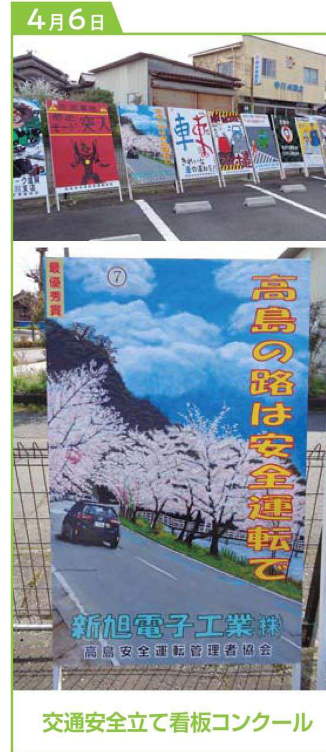
交通安全立て看板コンクール