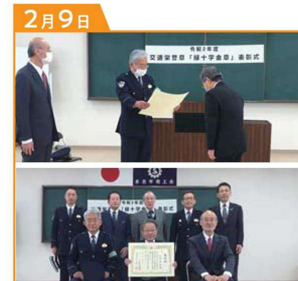
交通安全国民運動中央大会表彰伝達式