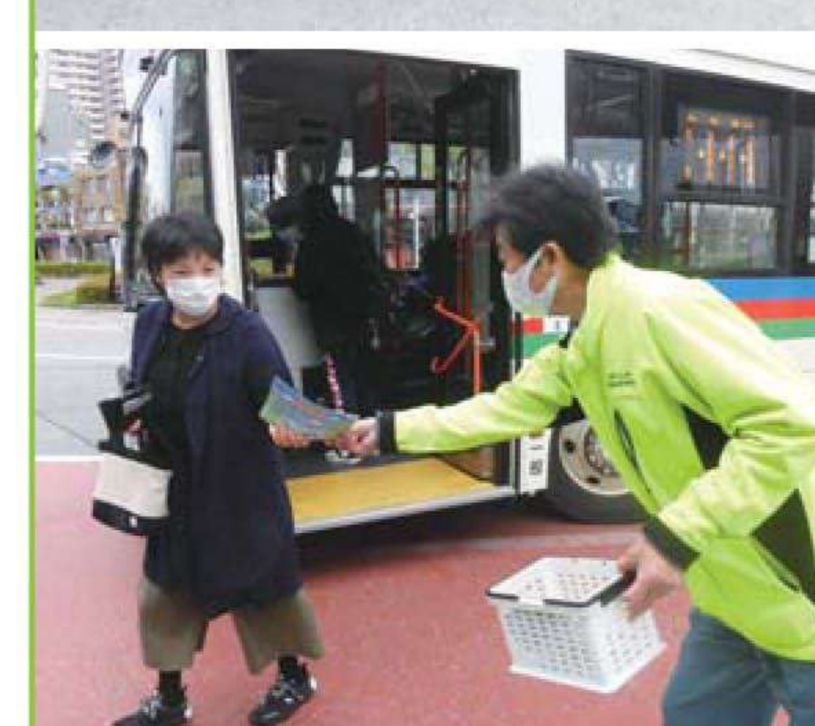
春の全国交通安全運動街頭啓発 JR彦根駅前