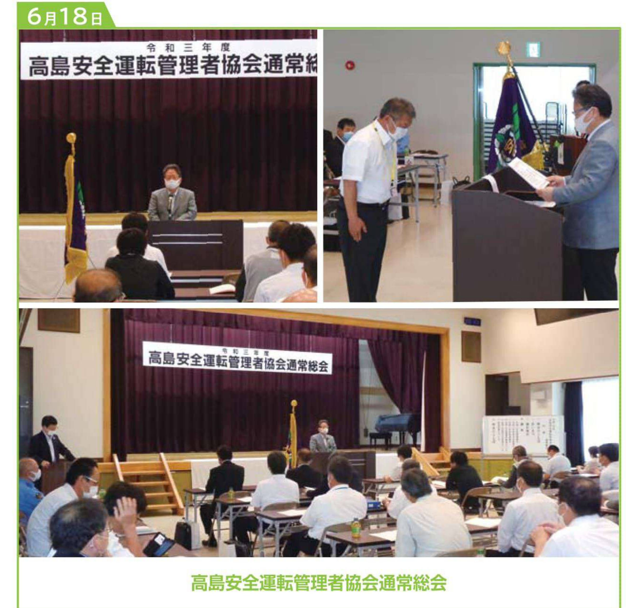
高島安全運転管理者協会通常総会