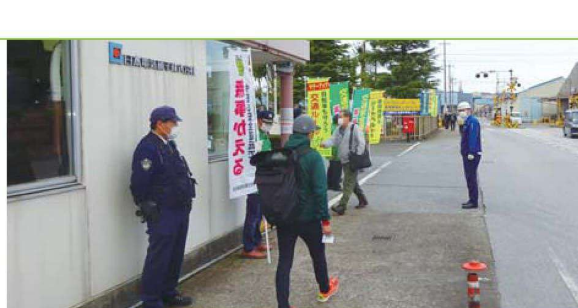
事業所前啓発活動