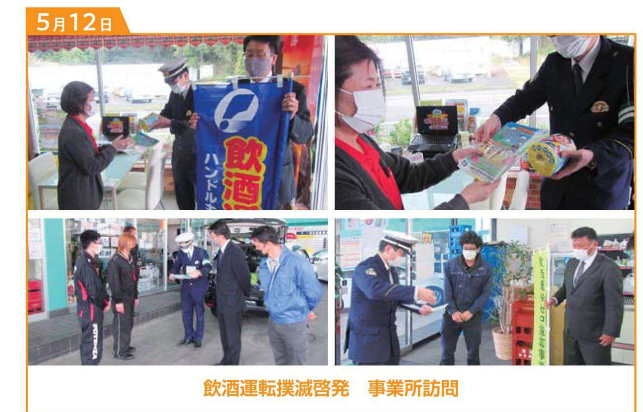
飲酒運転撲滅啓発 事業所訪問