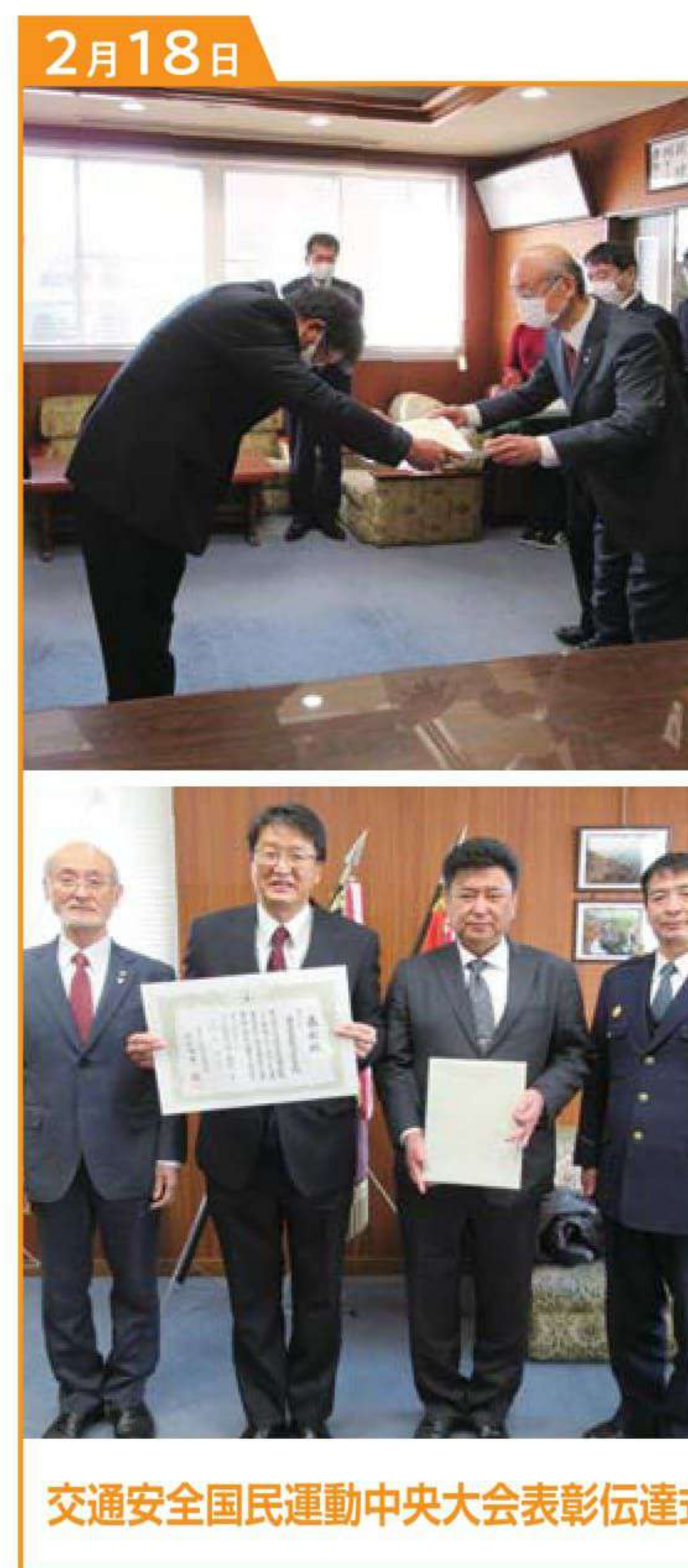
交通安全国民運動中央大会表彰伝達式