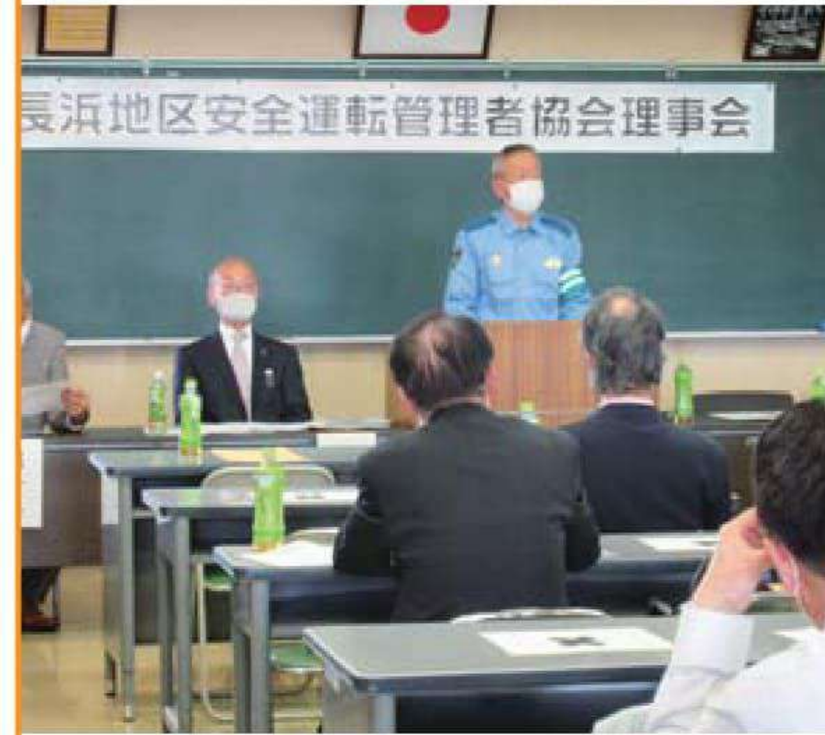
長浜地区安全運転管理者協会理事会