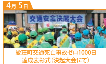
愛荘町交通死亡事故ゼロ1000日 達成表彰式(決起大会にて)