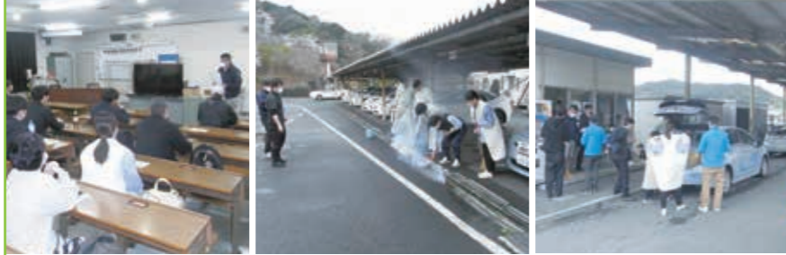
安全運転技能点検研修会