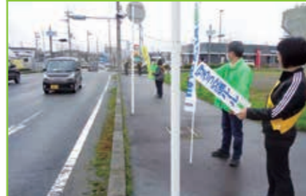
春の全国交通安全運動啓発活動 安曇川