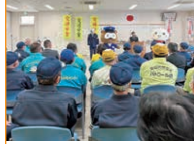
春の全国交通安全運動出動式 米原警察署