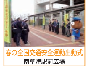
春の全国交通安全運動出動式 南草津駅前広場