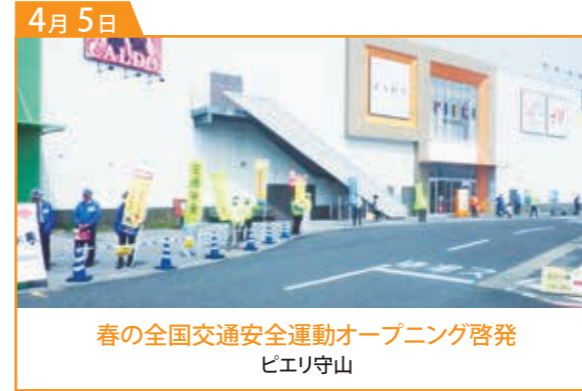
春の全国交通安全運動オープニング啓発 ピエリ守山