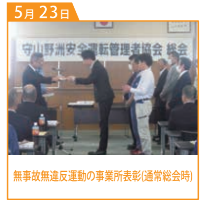
無事故無違反運動の事業所表彰(通常総会時)