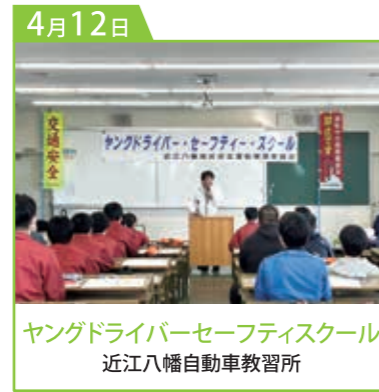
ヤングドライバーセーフティスクール 近江八幡自動車教習所