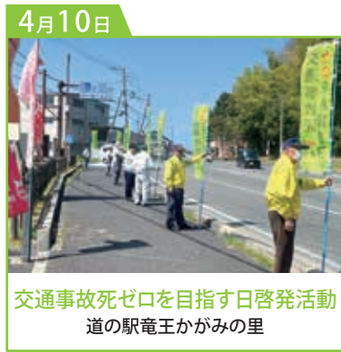
交通事故死ゼロを目指す日啓発活動 道の駅竜王かがみの里