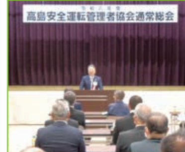
令和6年度 通常総会