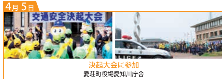
決起大会に参加 愛荘町役場愛知川庁舎