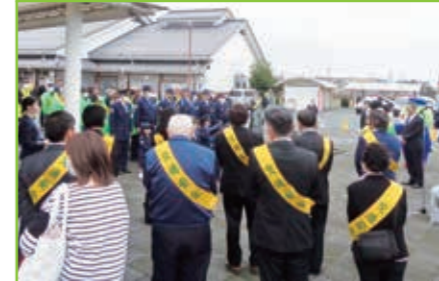
春の全国交通安全運動出発式 道の駅藤樹の里あどがわ