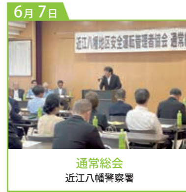
通常総会 近江八幡警察署