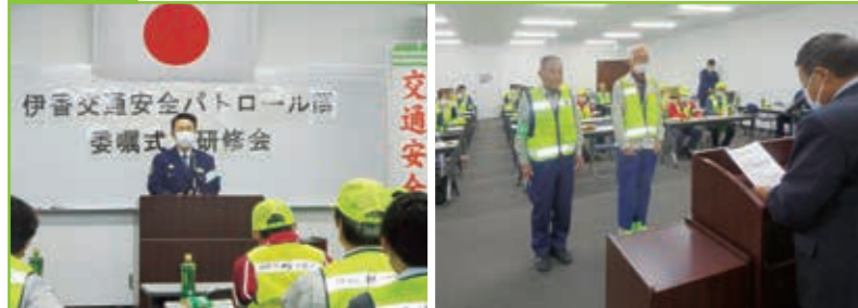
伊香交通安全パトロール隊委嘱式 高月まちづくりセンター