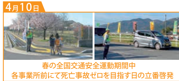
春の全国交通安全運動期間中 各事業所前にて死亡事故ゼロを目指す日の立番啓発