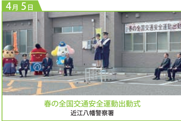
春の全国交通安全運動出動式 近江八幡警察署