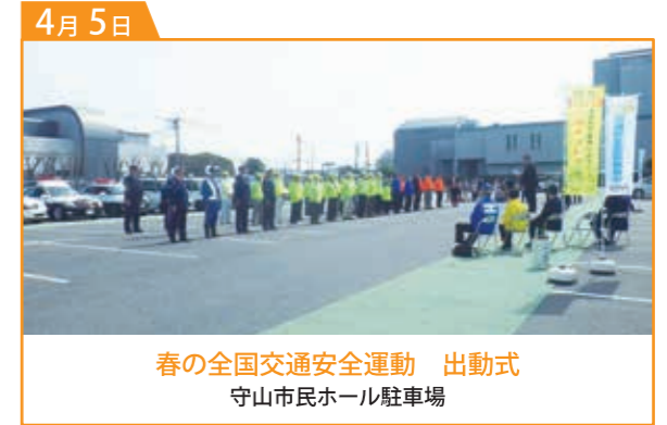
春の全国交通安全運動 出動式 守山市民ホール駐車場