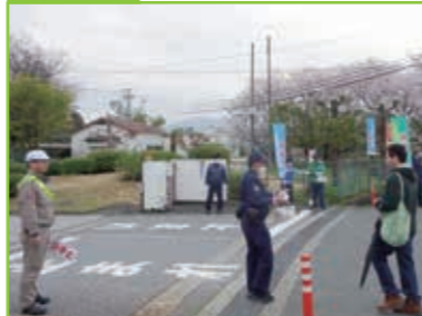
交通安全運動 事業所前啓発