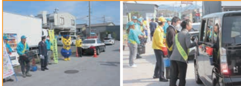
交通死亡事故ゼロ啓発活動 勇輝フーズ前