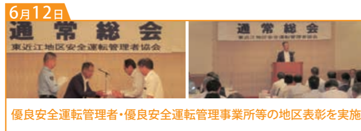
優良安全運転管理者・優良安全運転管理事業所等の地区表彰を実施