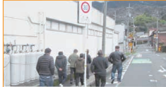
鳥取県用瀬地区のゾーン30視察