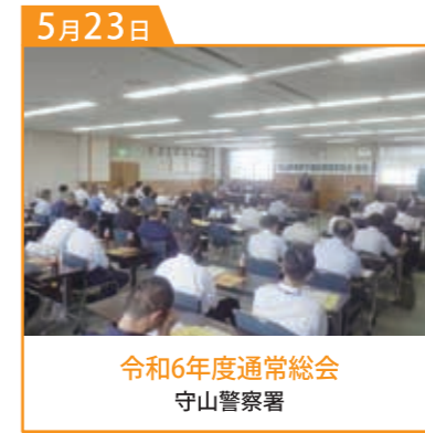
令和6年度通常総会 守山警察署