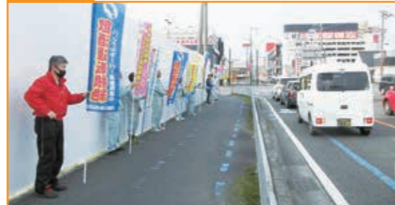
交通安全のぼり旗啓発