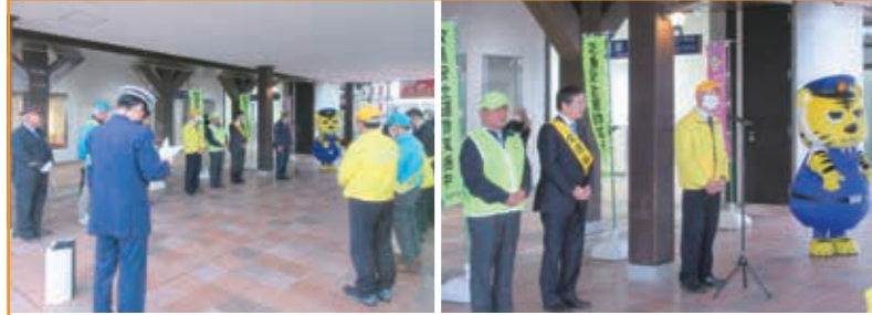
交通安全啓発活動 長浜駅前