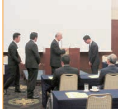
無事故無違反表彰