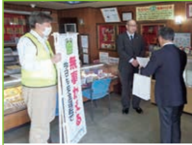
「無事故かえる」表彰 事業所訪問 各事業所