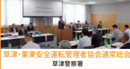
草津・栗東安全運転管理者協会通常総会 草津警察署