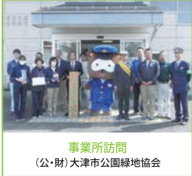
事業所訪問 (公・財)大津市公園緑地協会