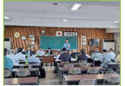
定例通常総会 彦根警察署