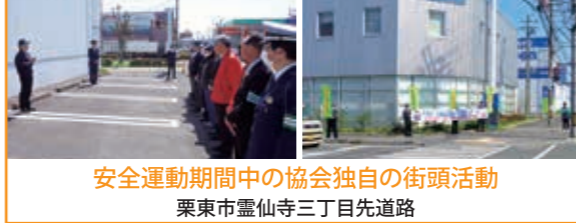
安全運動期間中の協会独自の街頭活動 栗東市霊仙寺三丁目先道路