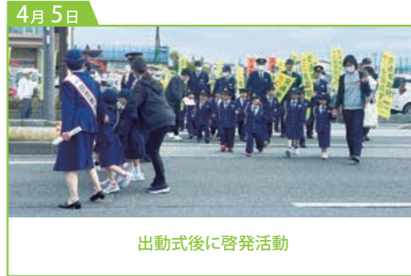
出動式後に啓発活動