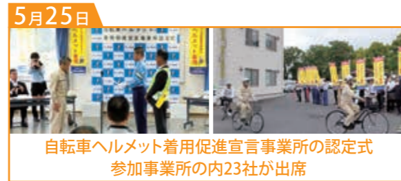
自転車ヘルメット着用促進宣言事業所の認定式 参加事業所の内23社が出席