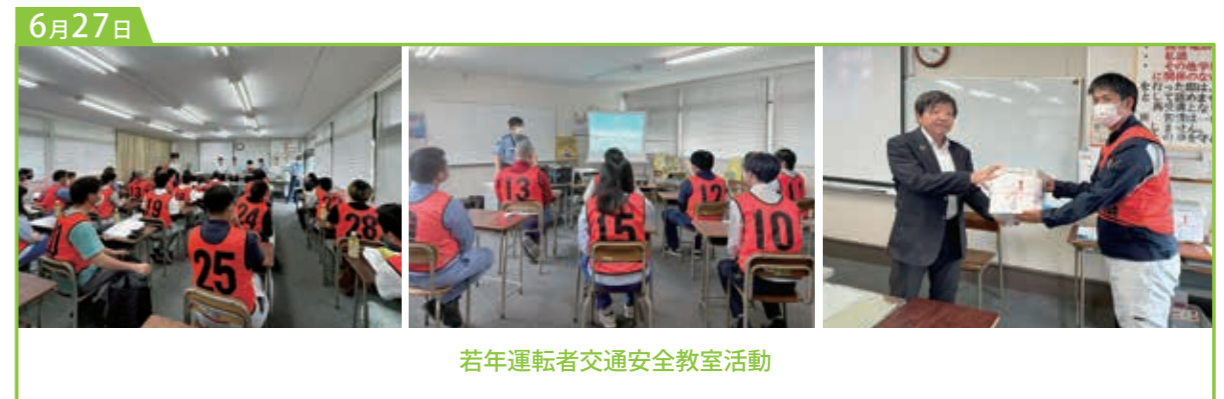
若年運転者交通安全教室活動