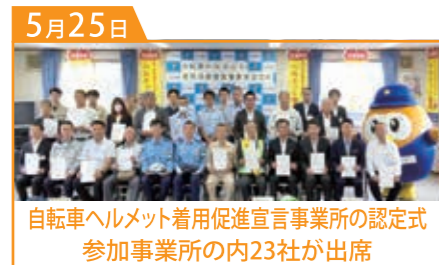
自転車ヘルメット着用促進宣言事業所の認定式 参加事業所の内23社が出席