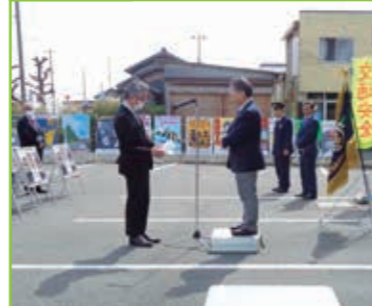
立て看板コンクール パネルリレー