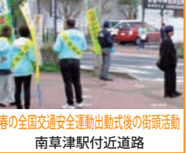
春の全国交通安全運動出動式後の街頭活動 南草津駅付近道路