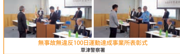
無事故無違反100日運動達成事業所表彰式 草津警察署