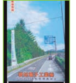
立て看板コンクール 最優秀賞(新旭電子工業)