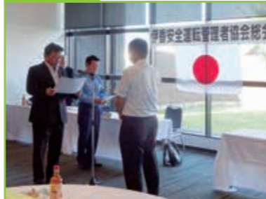
令和5年度無事故・無違反100日運動表彰式