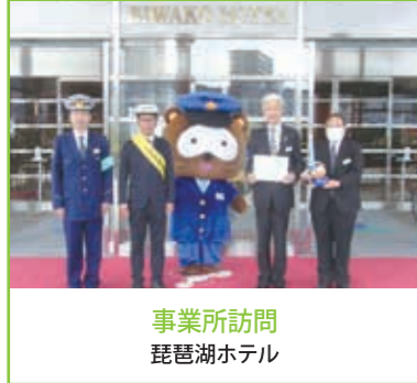
事業所訪問 琵琶湖ホテル