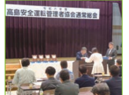
令和6年度 優良事業所等表彰式