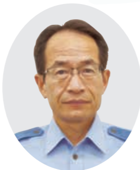
滋賀県警察本部交通部