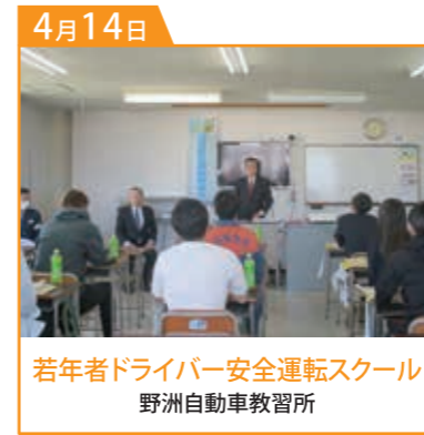
若年者ドライバー安全運転スクール 野洲自動車教習所