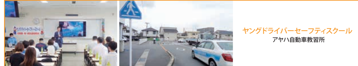
ヤングドライバーセーフティスクール アヤマ自動車教習所